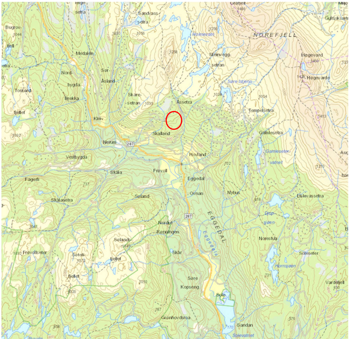
Planområdet vises med rød sirkel. Området ligger om lag 6,5 km kjøring fra Eggedal sentrum.