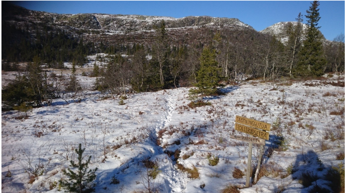
Tursti mot Hollerudsetra og Drotninggutua