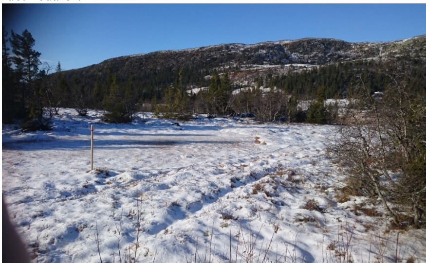
Skiløype fra bilveg ut på Korsmyran

Merka tursti mot Drotninggutua og Hollerudsetra er bevart og vist på reguleringsplanen. Se ellers bildet nedafor.