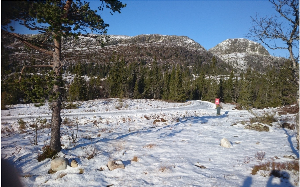
Landskap nordover mot Drotninggutunatten, ny tomt N16 midt på bildet