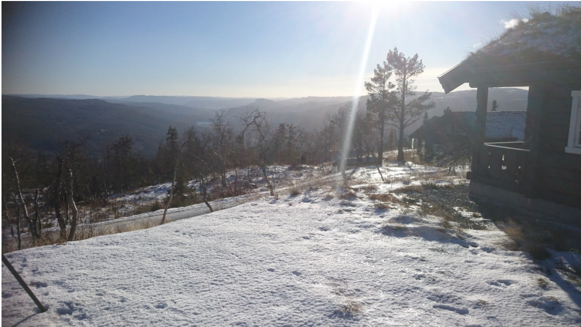
Utsikt mot Solevatn og Andersnatten

Det er satt krav til maks tillatt fylling/ skjæring. Sår i terrenget etter vegbygginga skal minimaliseres og påføres skogsjord før tilsåing.