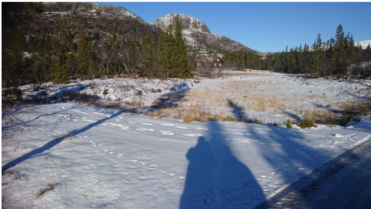
Avkjørsel til tomt N13, N14 og N15. Dronninggutunatten i bakgrunnen

Alle terrenginngrep skal planlegges og utføres slik at de visuelle skadevirkningene blir så små som mulig. Se ellers reguleringsbestemmelsene der det er lagt inn vilkår for å begrense fyllingers/skjæringsers uheldige virkning i landskapet.