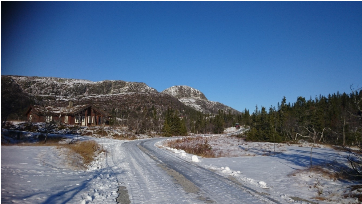
Tomt N6 på høyre side av vegen. Drotninggutunatten i bakgrunnen