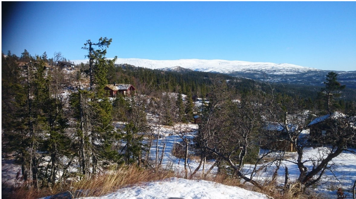
Tomt 7, 37 og 39 - med Norefjell i bakgrunnen

Planområdet ligger i Landskapsregion 14: Fjellskogen i Sør-Norge. Planområdet ligger delvis i ei hellende, sørvendt lise med blandingsskog, delvis på flatere landskap/platå ved Korsmyran. Nye hytter er plassert som fortetting på ledige arealer i et tidligere utbygd hyttefelt. Tidligere naturinngrep ved utbygging av hyttefeltet er ikke spesielt eksponert i landskapet.