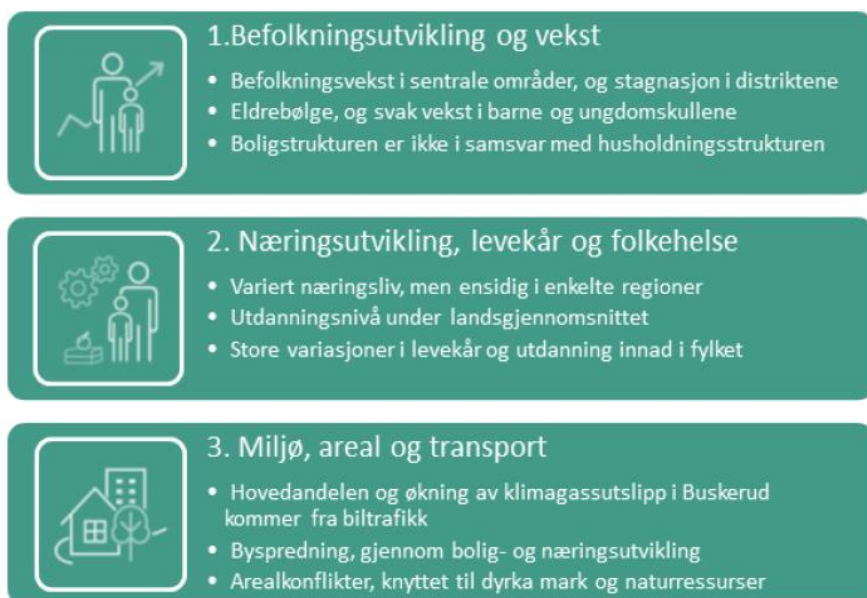
Fig. 2. Hovedtema fra Regional planstrategi for Buskerud 2017 - 2020.

Det er fokusert på 3 hovedtemaer, med underliggende utfordringer. Hovedtemaene og utfordringene er ikke altomfattende, men skal vise sentrale utviklingstrekk og utfordringer i Buskerud som det er viktig å ha fokus på i et langsiktig perspektiv.